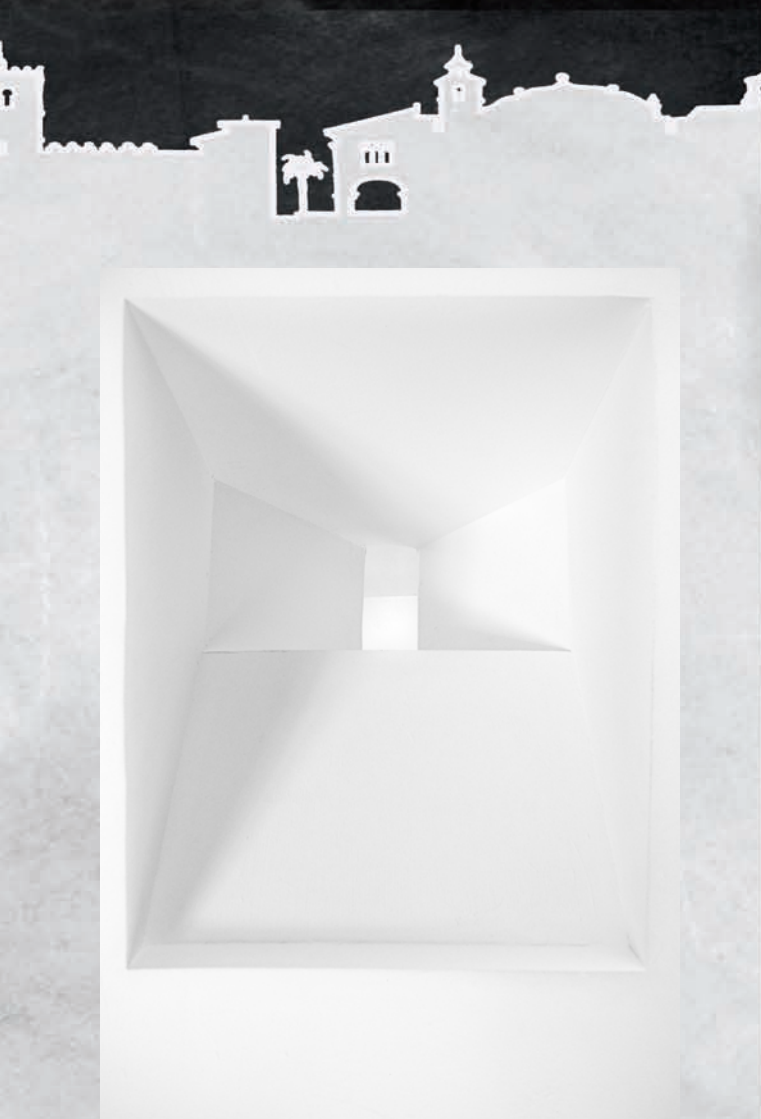
1er premi II Concurs Nacional Fotografia